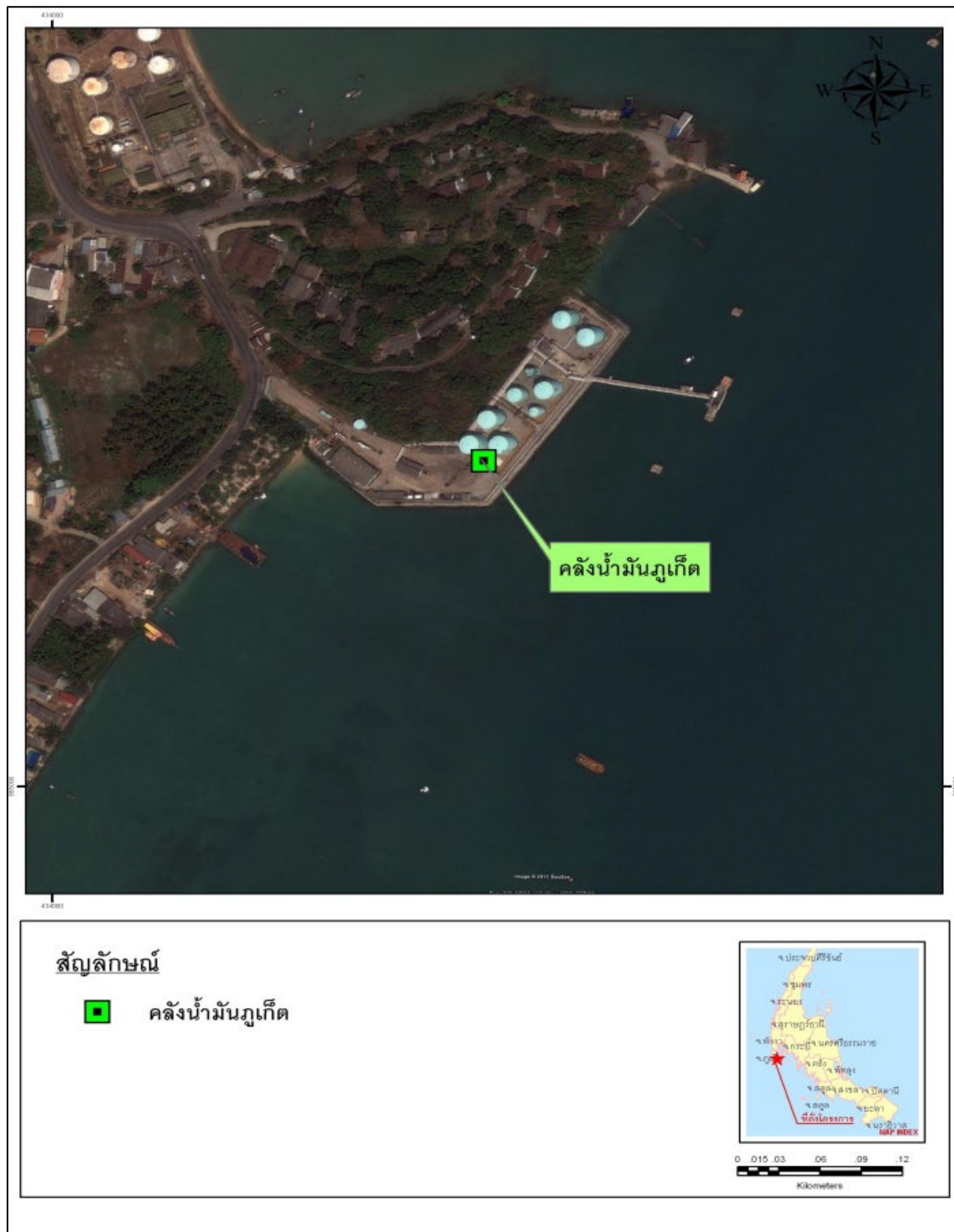
รูปที่ 1-1 ที่ตั้งโครงการทำเทียบเรือและคลังน้ำมันภูเก็ต ของบริษัท ปตท. น้ำมันและการค้าปลีก จำกัด (มหาชน)